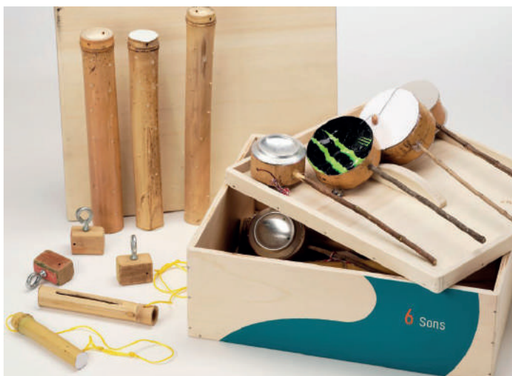
Une des boites composant la Petite collection