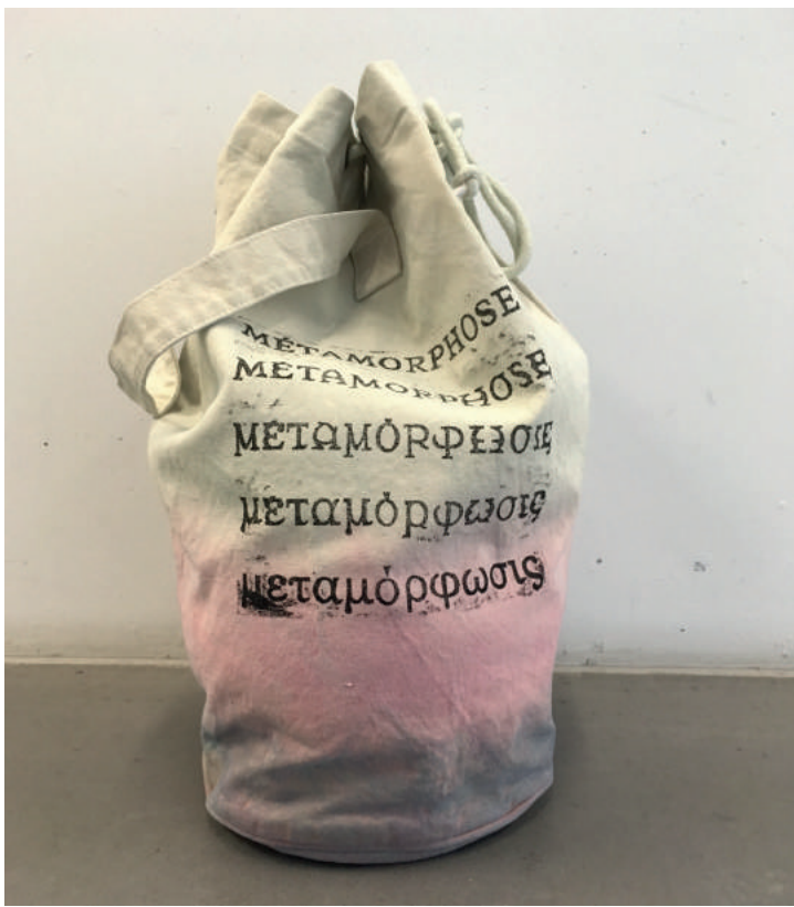
Le Sac métamorphose