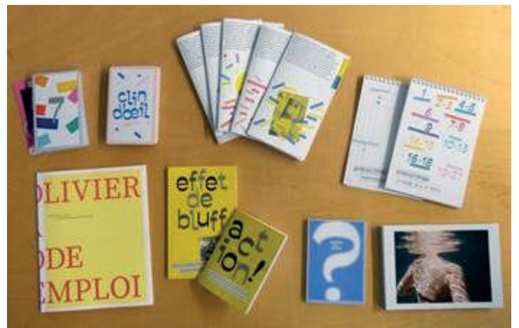
Les livrets du Studio de poche Olivier Rebufa