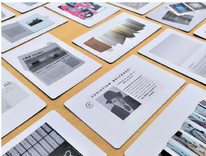
Le jeu Qui suis-je? du sac Délivrez-vous !