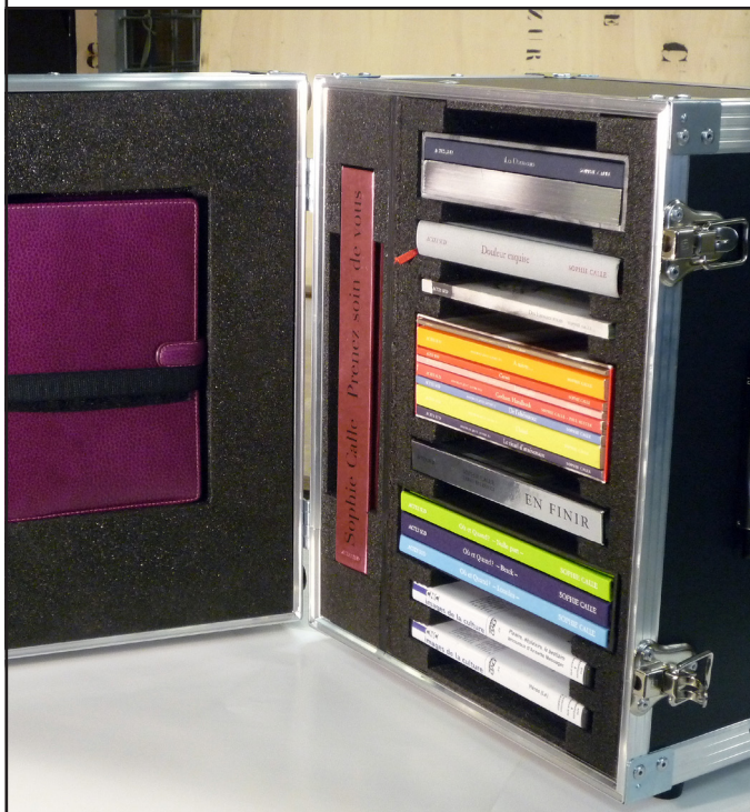
La Valise l'autobiographie selon Sophie Calle

Récolte d'accessoires pour atelier avec la Valise l'autobiographie selon Sophie Calle