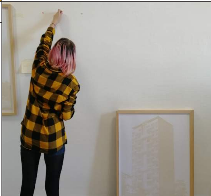
Montage de l'exposition Mundo Diffuso, un monde f[!]ou , lycée Théodore Aubanel, Avignon

L'Art tangent en valise circule une fois par an selon une logique de territoire. Ce dispositif est proposé aux lycées de la région qui s'engage à suivre la formation qui lui est lié, et qui est organisée chaque année.