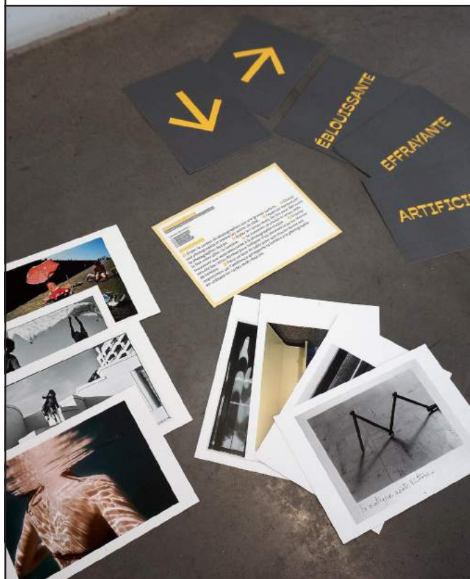
Le jeu Faites parler la lumière

Imaginé par l'équipe du Frac et l'artiste Olivier Rebufa en partenariat avec le Centre Photographique Marseille, le Studio de Poche Olivier Rebufa s'appuie sur la Série Télé, ensemble de cinq œuvres acquises par le Frac en 1997. Cet outil propose un matériel original pour découvrir et expérimenter la pratique de l'artiste autour des thématiques du cinéma, de la photographie, de l'histoire de l'art ou encore du récit et de l'autobiographie. Le Studio de poche offre des possibilités de développement multiples : pratique photographique, jeux, lecture d'image, mise en scène, ateliers, etc.