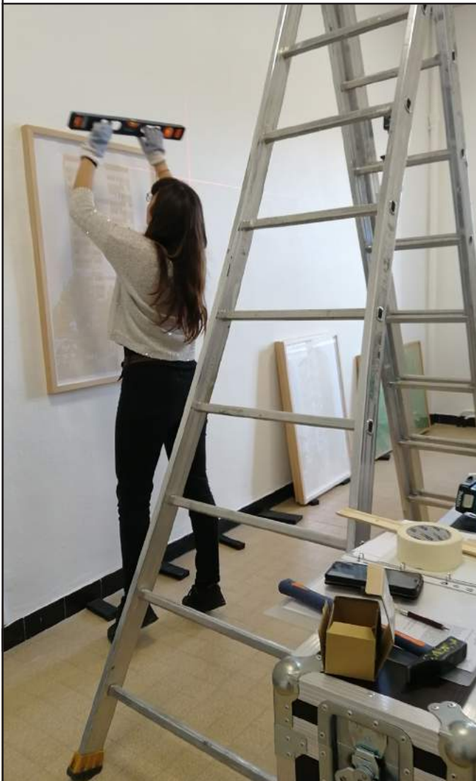
Montage de l'exposition Mundo Diffuso, un monde f[!]ou , lycée Théodore Aubanel, Avignon

Les projets Frac à la carte se déroulent selon des partenariats engagés sur trois ans. Le prochain appel à projet à l'attention des structures souhaitant entreprendre une collaboration sera ouvert au printemps 2021 .