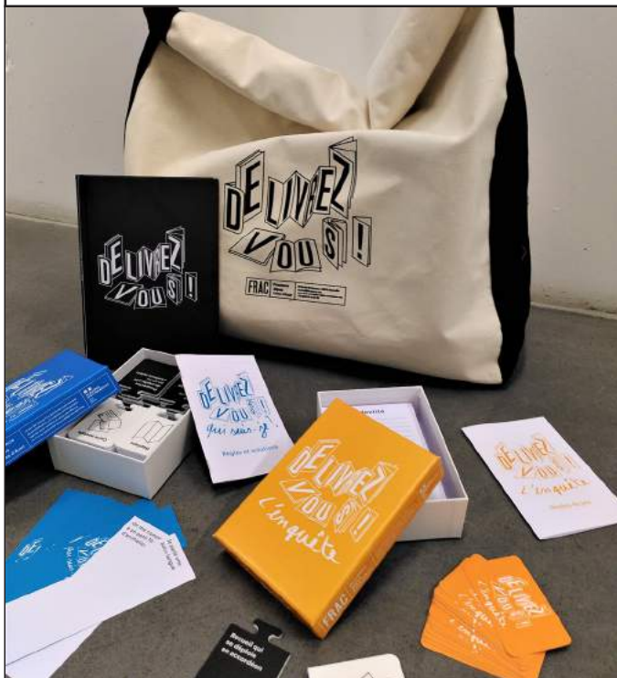
La sac DéLIVREZ-vous ! et le jeu Qui suis-je ?

DéLIVREZ-vous ! est un outil pédagogique nomade qui aborde la diversité des formes que peut prendre l'édition d'artiste aujourd'hui. Réunis dans un sac accompagnés de jeux et activités, le panel d'ouvrages présentés met en regard une sélection de livres et d'éditions d'artistes variée. Il propose de découvrir les multiples appropriations de ce médium par les artistes. Associé à une présentation du fonds Livres éditions et multiples d'artistes du Frac, ce dispositif met en lumière des processus de création différents permettant de dépasser la vision classique du livre, d'appréhender la démarche des auteurs et ainsi de mieux relier l'intention et la forme, enjeu qui relève de toute œuvre d'art contemporain.