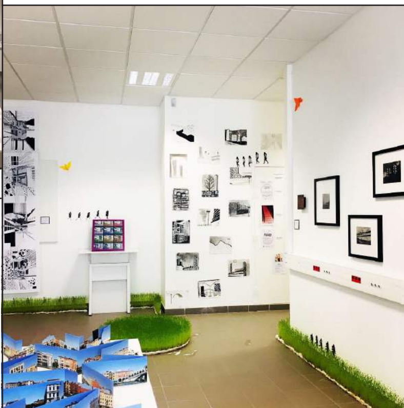
Exposition La cité , cité scolaire de Vaison-la-Romaine