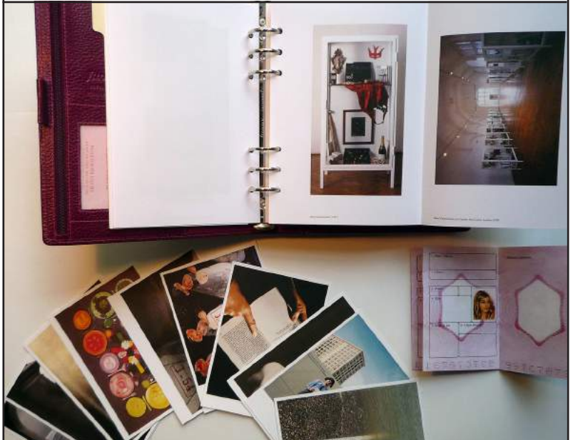
Les documents d'accompagnement de la Valise l'autobiographie selon Sophie Calle