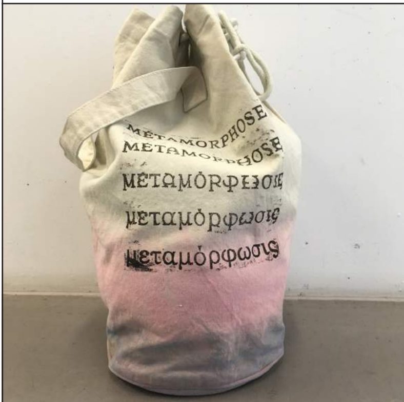
Le Sac métamorphose