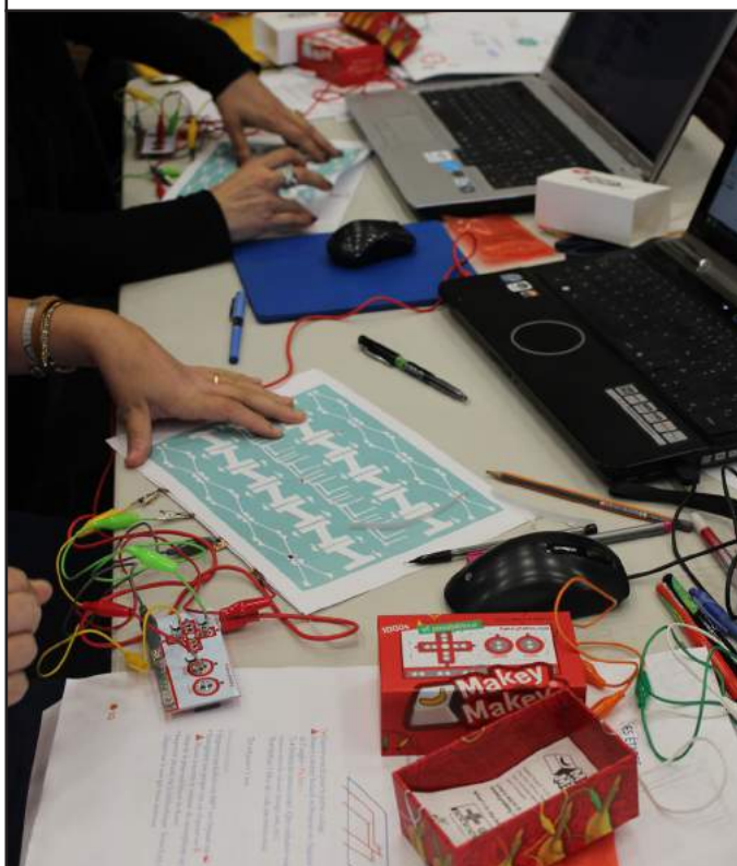
Circuits courts, atelier à l'école élémentaire de Lourmarin

La Fracomade est outil numérique de création et de médiation. Facile d'utilisation, elle permet de découvrir une sélection d'œuvres tout en abordant les technologies actuelles. L'outil propose d'interpréter une œuvre de la collection du Frac et de créer une affiche interactive. À l'aide du matériel électronique, d'un ordinateur et d'un logiciel d'animation, s'ouvrent de multiples possibilités d'interactions : déclenchement de sons, vidéos, textes, animations. Grâce à la réalité augmentée, la Fracomade dévoile les œuvres sous un autre angle et permet au groupe de penser et réaliser de manière collective un projet de médiation original.