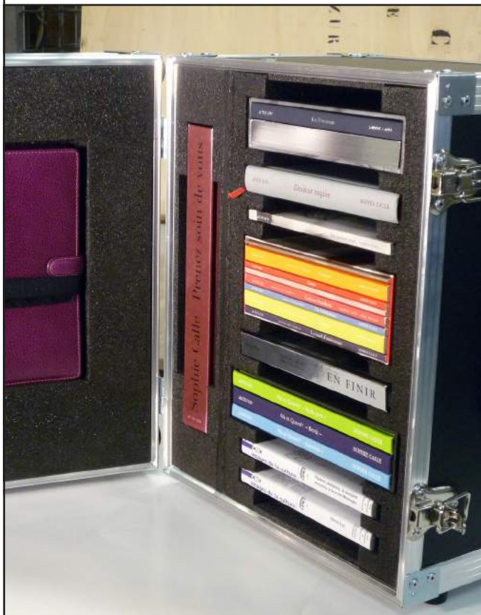
La Valise l'autobiographie selon Sophie Calle