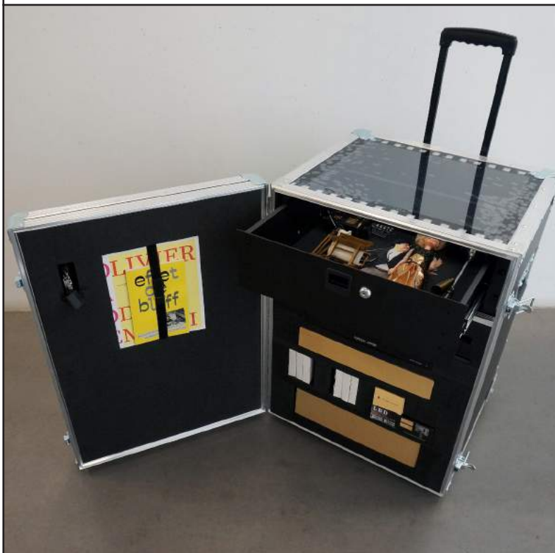
Le premier Studio de poche