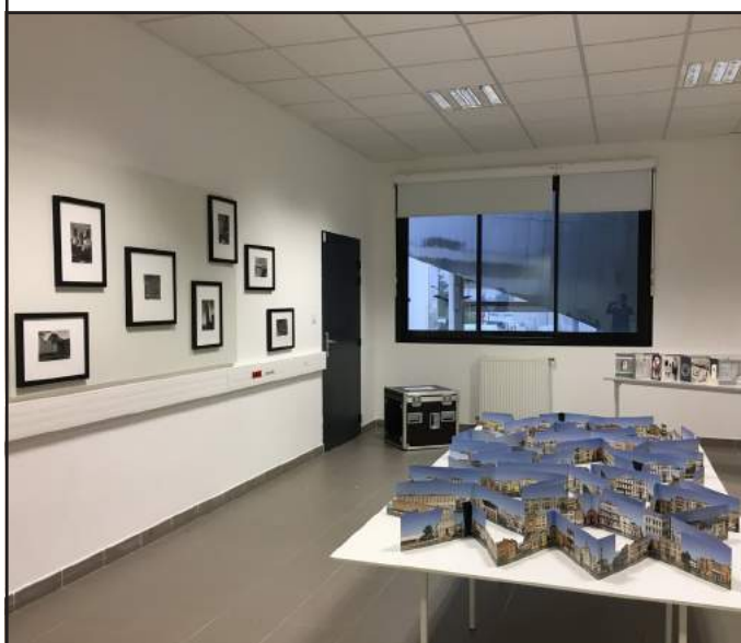
Exposition La cité , cité scolaire de Vaison-la-Romaine