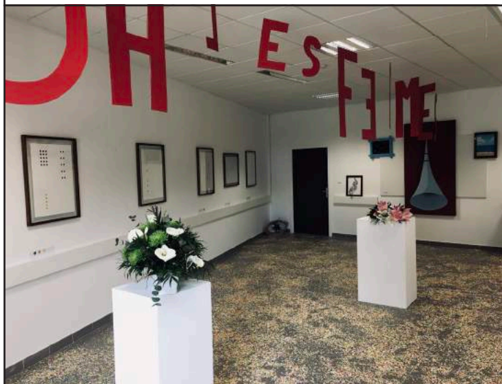
Exposition Oh les femmes ! , cité scolaire de Vaison-la-Romaine

Les dispositifs Frac à la carte , Mon expo de A à Z et Entrée des artistes se déroulent selon des partenariats engagés sur trois ans. Le prochain appel à projet à l'attention des structures souhaitant entreprendre une collaboration sera ouvert au printemps 2021 . Les projets d'Éducation Artistique et Culturelle menés en partenariat avec le Frac sont ensuite sélectionnés par un comité de pilotage.