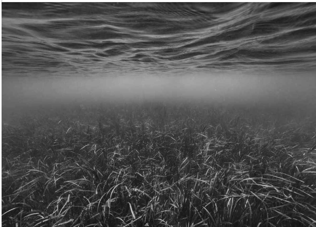
/ Nicolas Floc'h, Initium Maris, Ile callot , 2019.

Prolonger une photographie de Nicolas Floc'h en imaginant le paysage à la surface de l'eau.