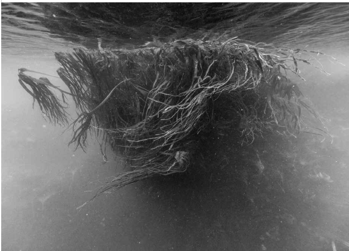
/ Nicolas Floc'h, Initium Maris , Ouessant, 2019.

Prolonger une photographie de Nicolas Floc'h en imaginant le paysage à la surface de l'eau.