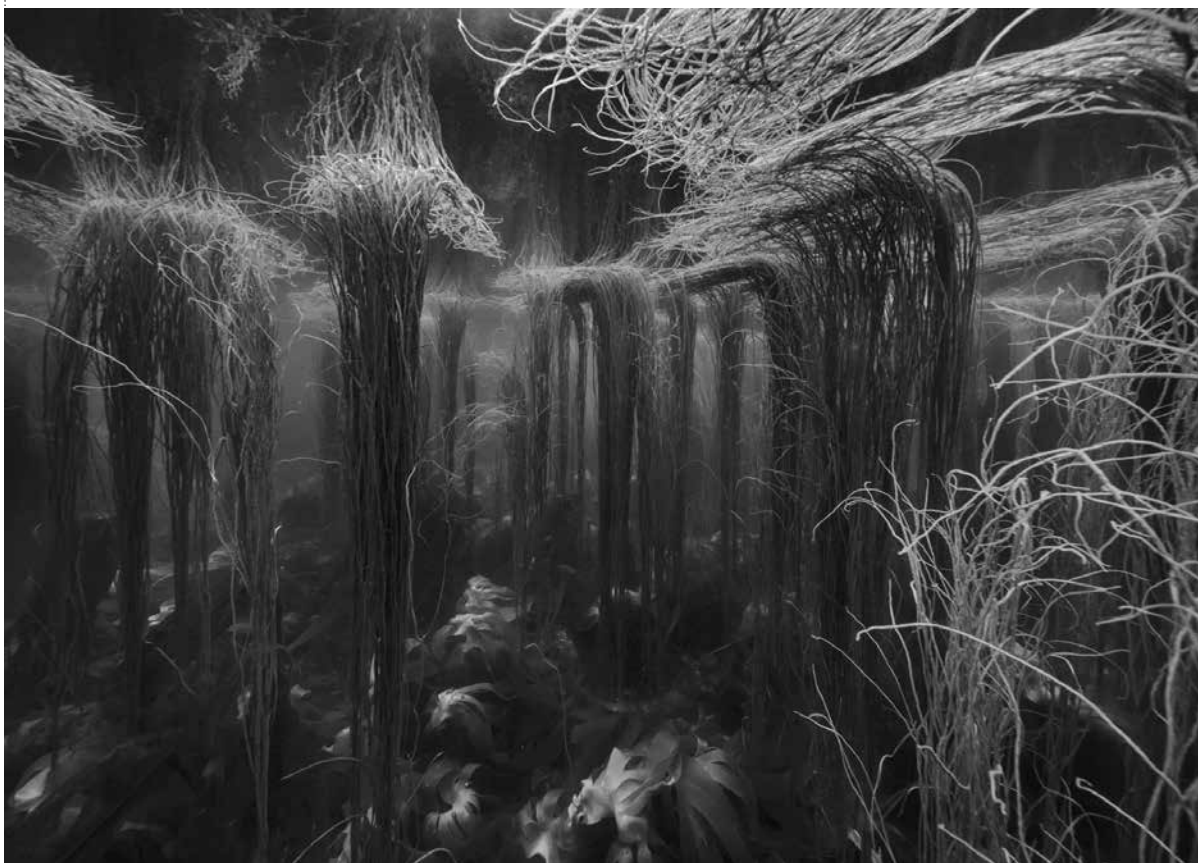
/ Nicolas Floc'h, Initium Maris, Molene, 2019.

Prolonger une photographie de Nicolas Floc'h en imaginant le paysage à la surface de l'eau.