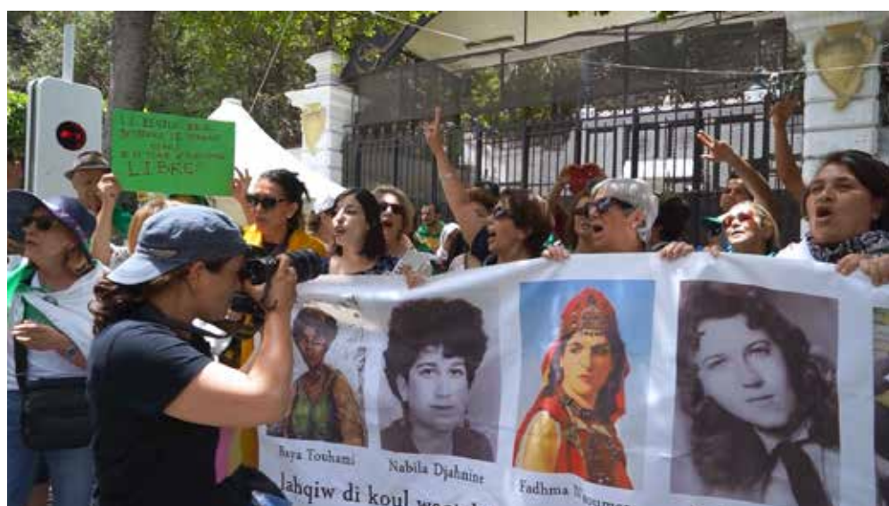
Katia Kameli, Le Roman algérien - chapitre 3, 2019, vidéo HD, 45 min. © Katia Kameli, ADAGP, Paris, 2021.