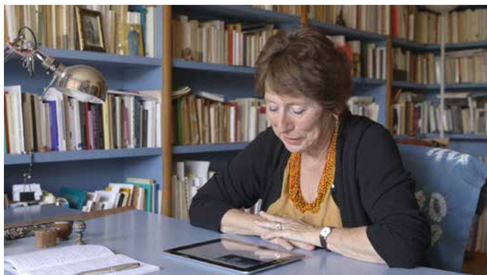
Katia Kameli, Le Roman algérien - chapitre 2, 2017, vidéo HD, 34 min. © Katia Kameli, ADAGP, Paris, 2021.