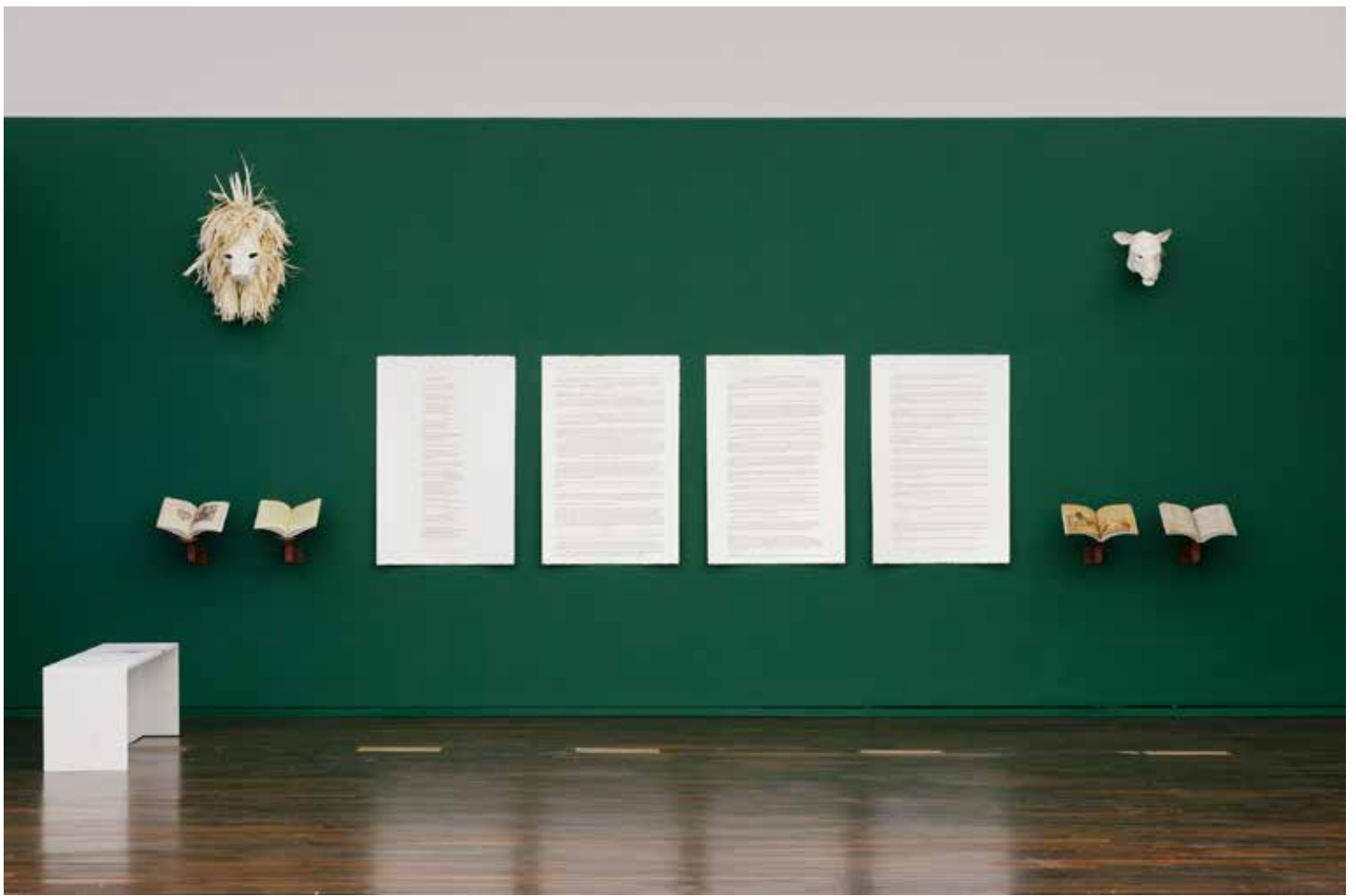
Vue d'exposition, Tous, des sang-mêlés , Mac Val, Vitry-sur-Seine, 2017. © Katia Kameli, ADAGP, Paris, 2021.