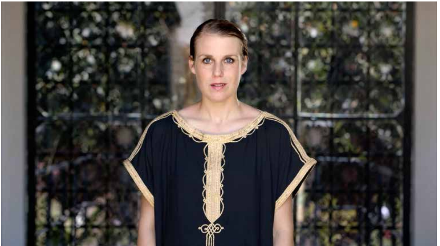
Katia Kameli, Stream of stories - chapitre 6, 2019. Vidéo HD, 19 min.