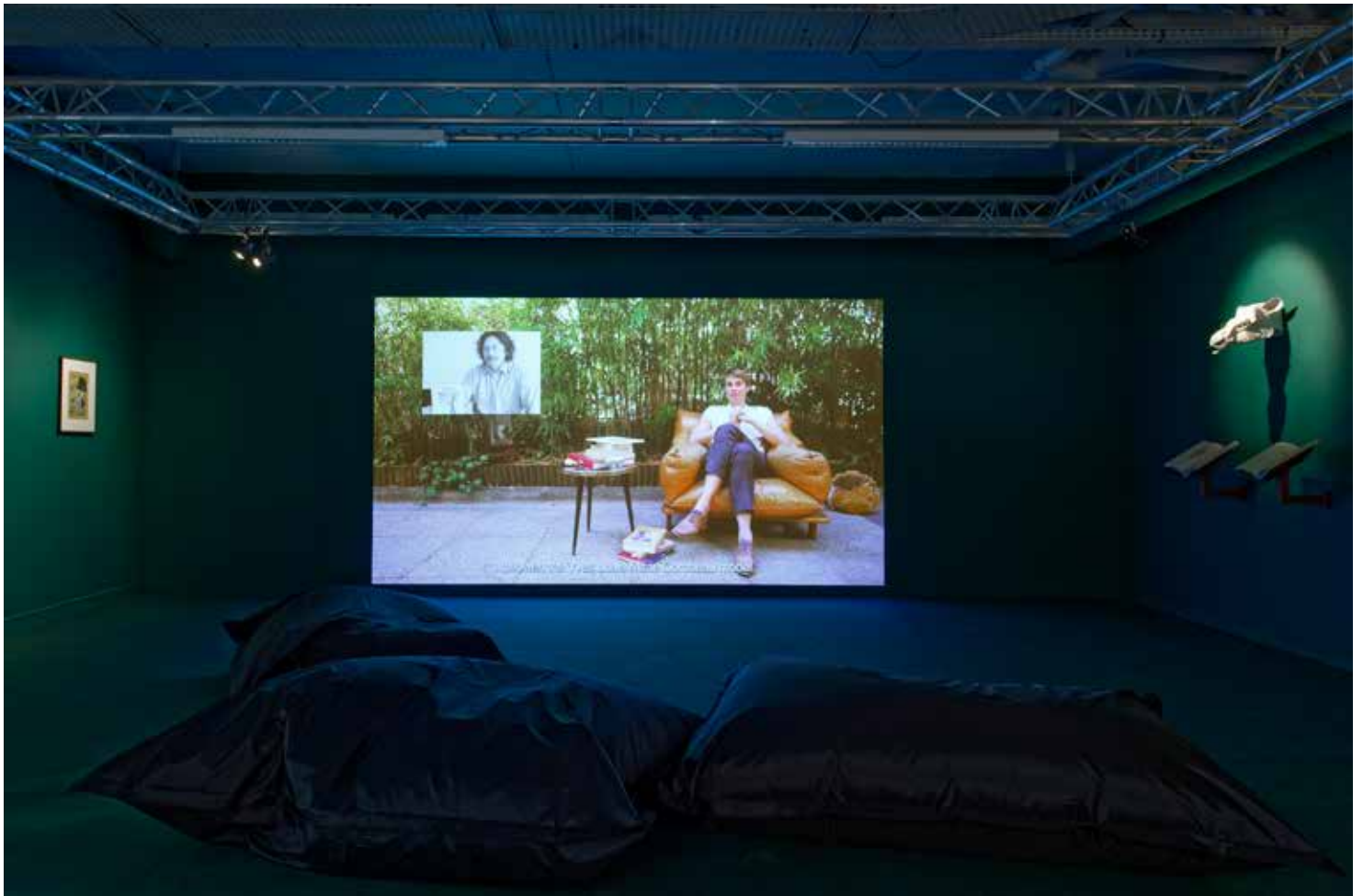
Katia Kameli, Stream of stories - chapitre 5, 2018. Vidéo HD, 34 min. © Katia Kameli, ADAGP, Paris, 2021. Vue de l'exposition au Phakt - Centre Culturel Colombier dans le cadre de la biennale Ateliers de Rennes en 2018.