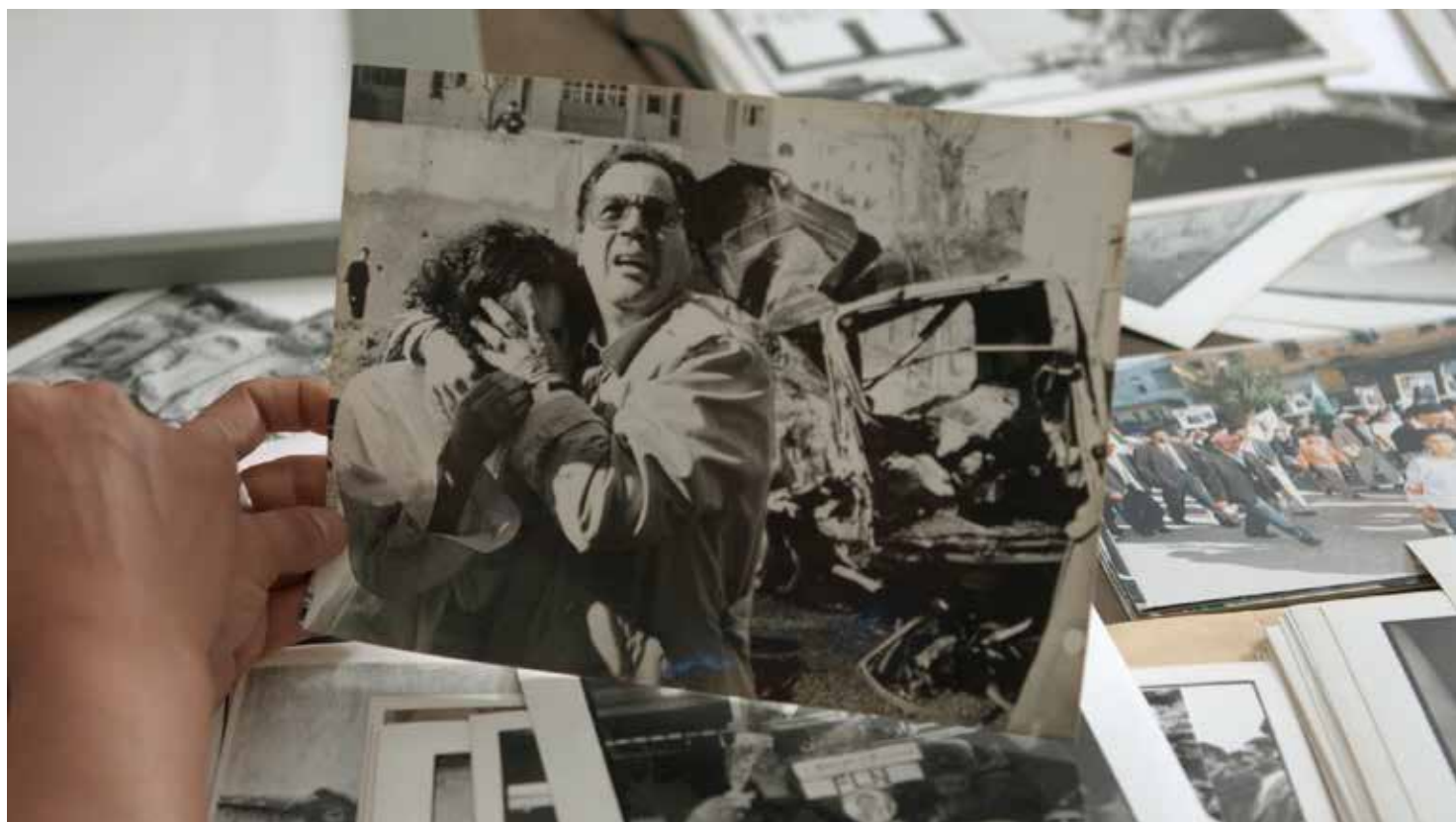
Katia Kameli, Le Roman algérien - chapitre 3, 2019, vidéo HD, 45 min. © Katia Kameli, ADAGP, Paris, 2021.