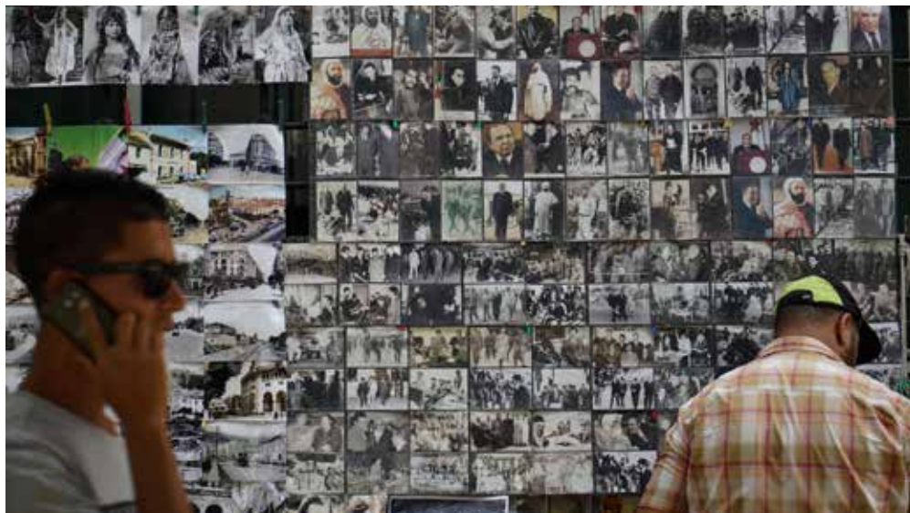
Katia Kameli, Le Roman algérien - chapitre 1, 2016, vidéo HD, 16 min. 35 s. © Katia Kameli, ADAGP, Paris, 2021.