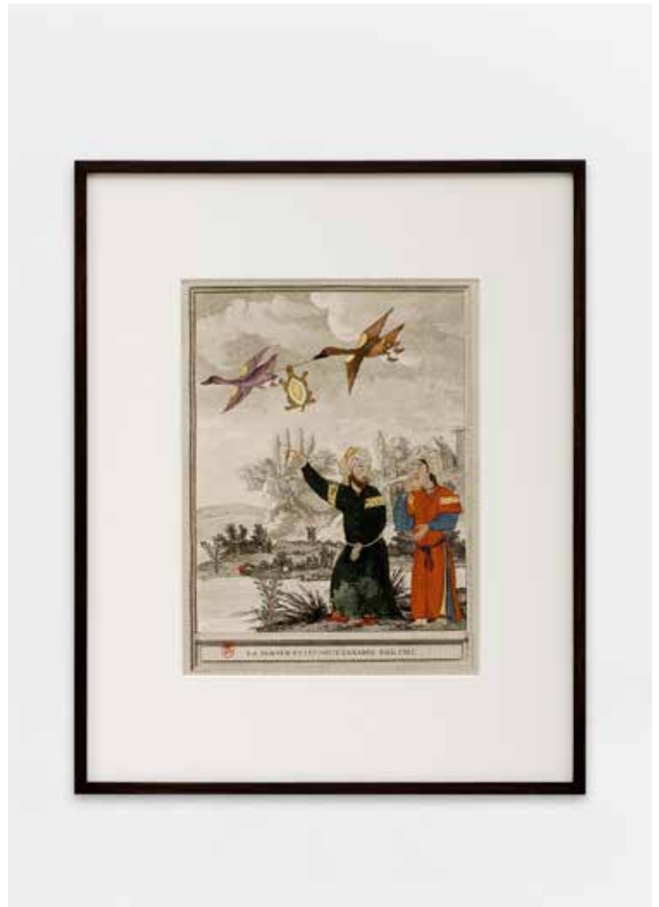
Katia Kameli, Les Animaux malades de la Peste; La Tortue et les deux canards , 2016, impression fine art et dorure à l'or 22 carat sur papier Bamboo. © Katia Kameli, ADAGP, Paris, 2021.