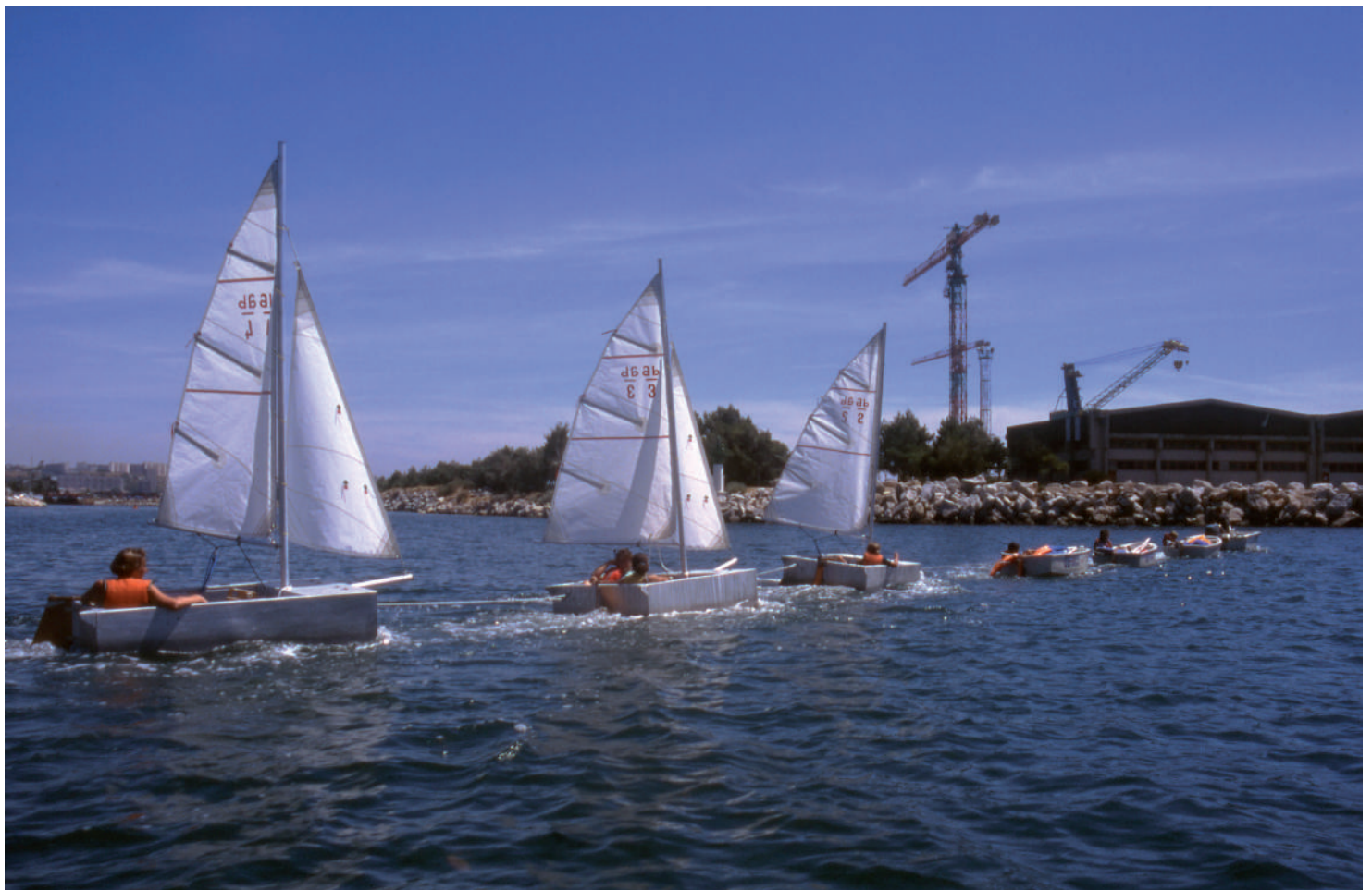
Rabe DP - école de voile SNEM - juillet 1995