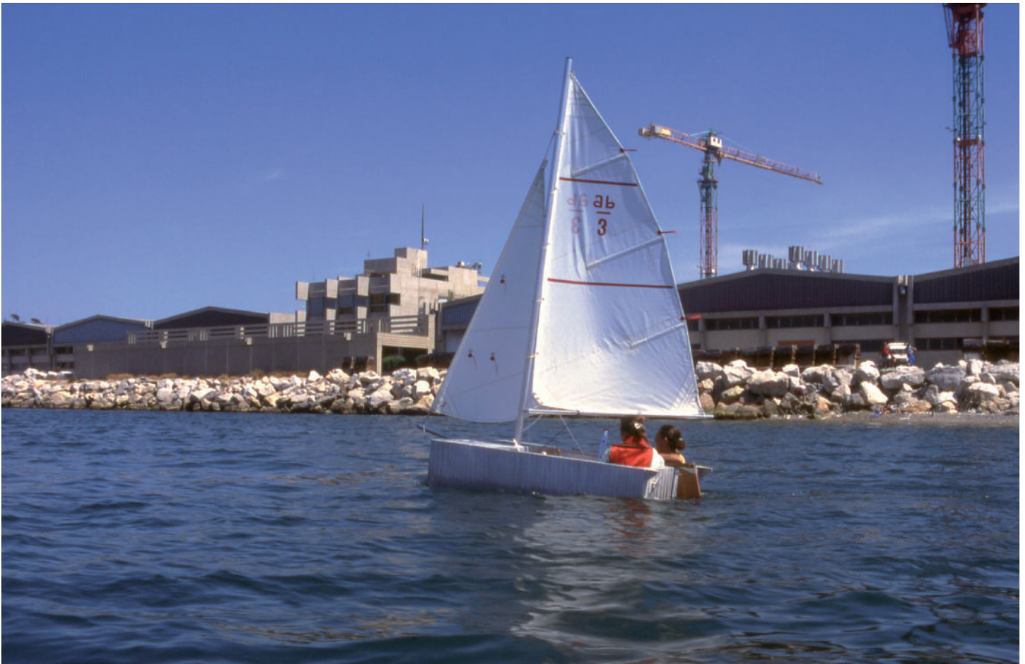
Rabe DP - école de voile SNEM - juillet 1995