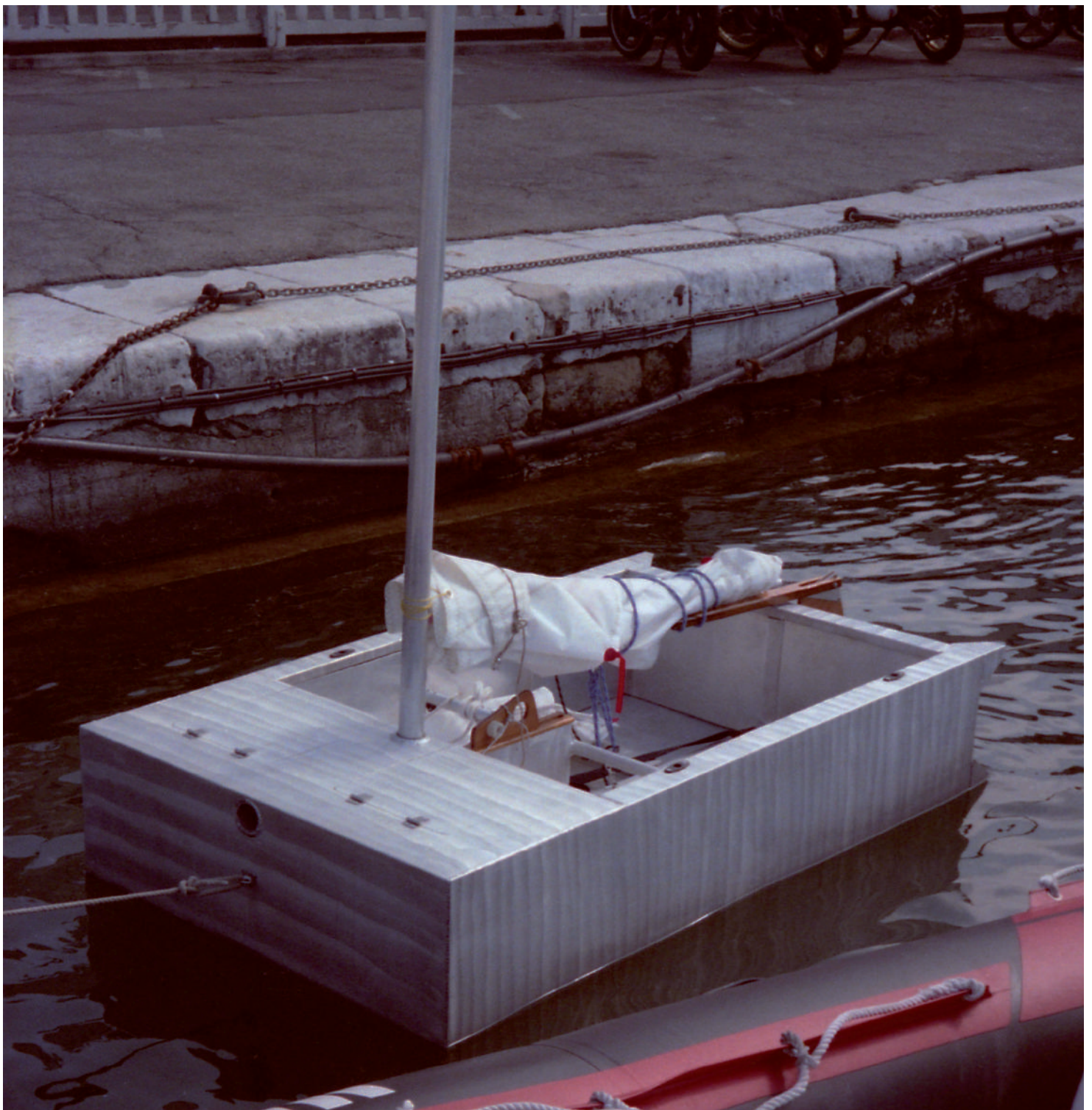
Rabe DP - abe n°3 SNM - juillet 1996