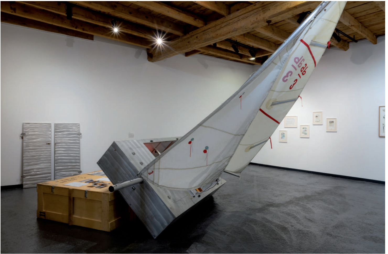
Vue de l'exposition Pas de côté au Centre d'art contemporain la Grange à Gap, 2023.