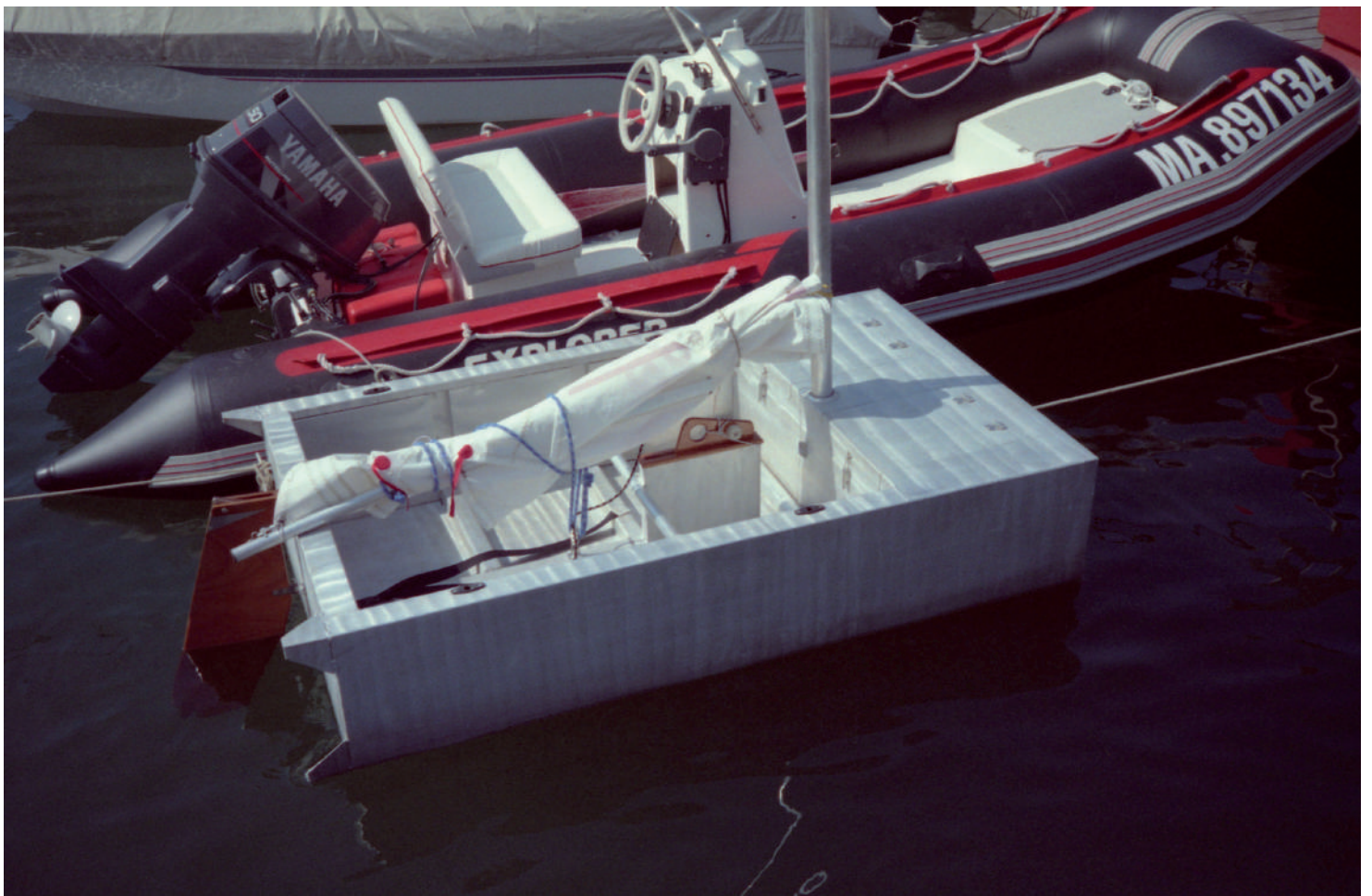
Rabe DP - abe n°3 SNM - juillet 1996