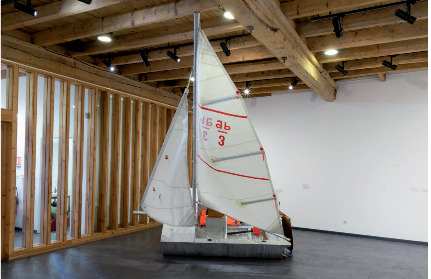
Vue de l'exposition Pas de côté au Centre d'art contemporain la Grange à Gap, 2023.