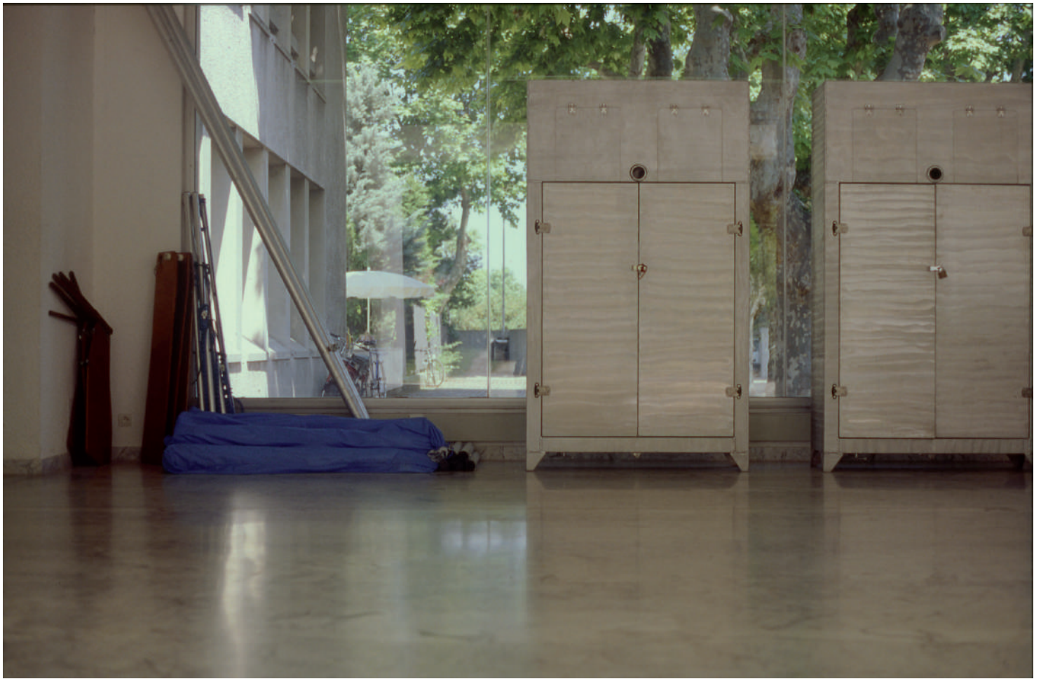
Rabe DP - armoire bateau école - expo MAC - 1996 - photo Bernard Bøesperflug