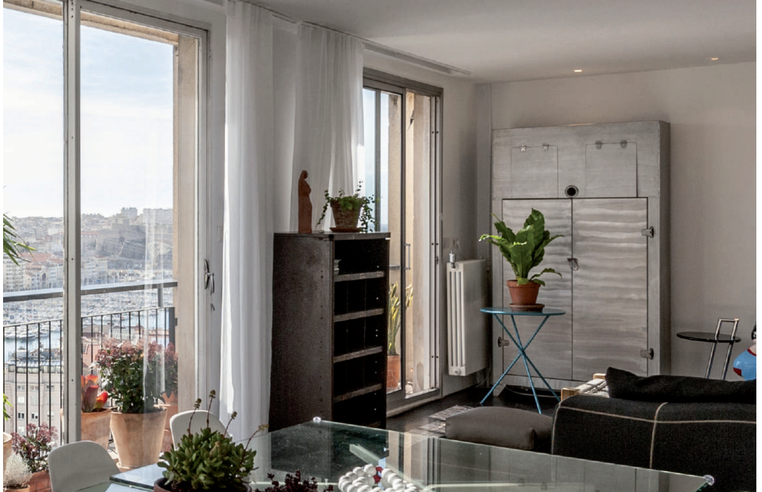
abe n°5 in situ Marseille - collection Ricciotti