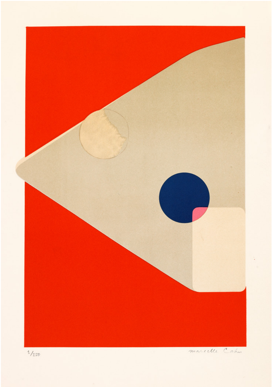
Marcelle Cahn, Sans titre , n.d.

Lithographie, 65,2 x 38,5 cm. FNAC 31010 Centre national des arts plastiques