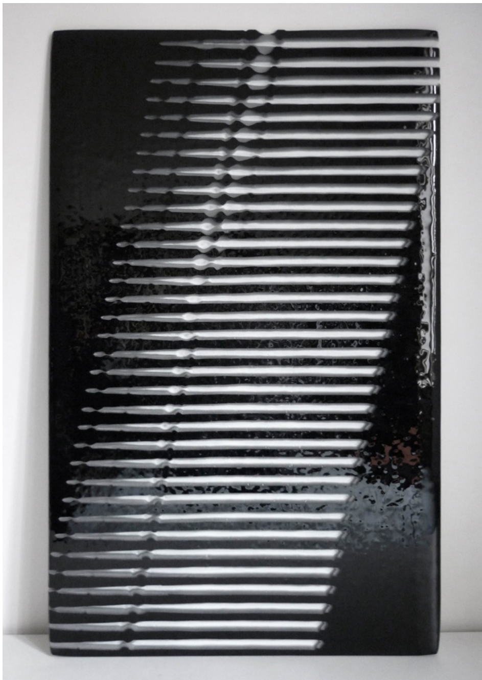
Bettina Samson, For a future exploration of dark Matter II , 2011

Verre fusionné et gravé par sablage, 101 × 62 cm.